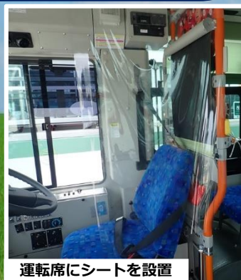
運転席にシートを設置