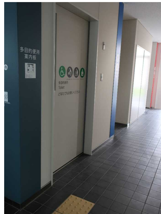
トイレドアの表示