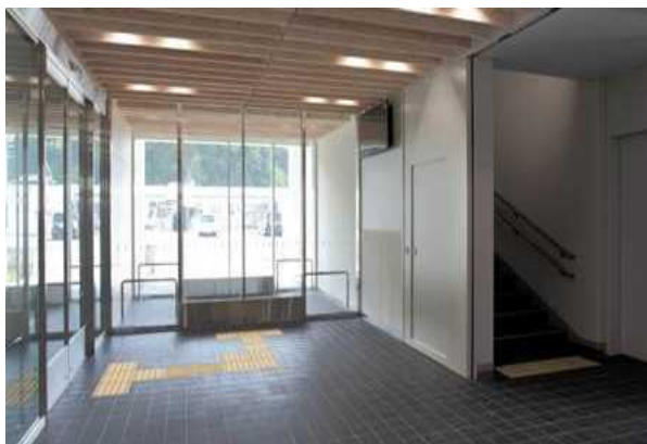
庁舎内(自動扉、点字表示)