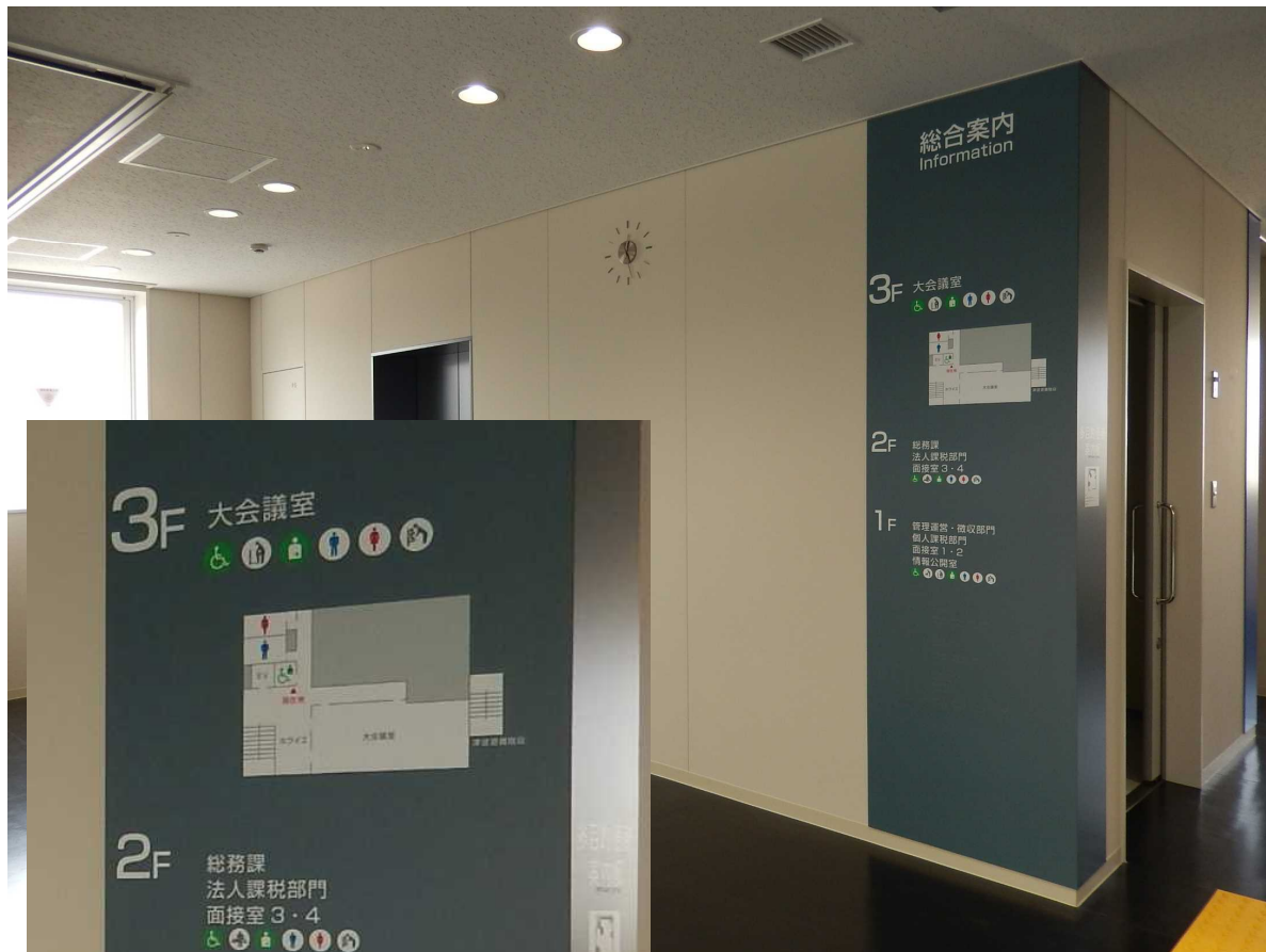
ホールの「多目的便所案内板」