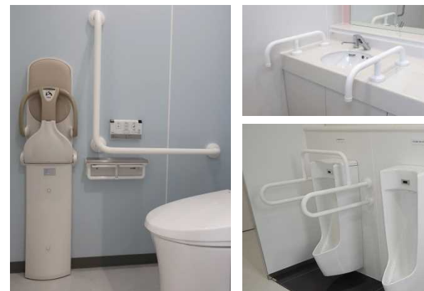
便所(手摺、ベビーチェア)