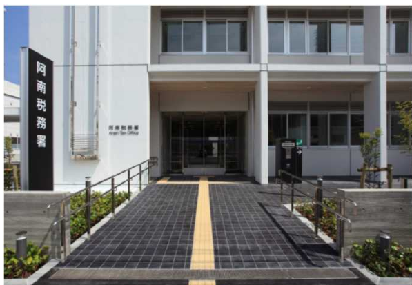
段差の無い敷地内アプローチ (手すり、点字表示の設置)