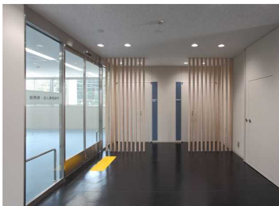
事務室出入口の自動扉化