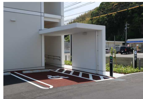
肢体不自由者用駐車スペース