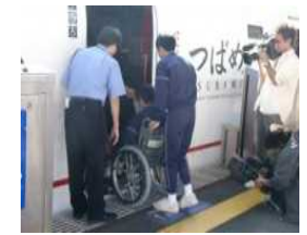
車椅子サポート体験