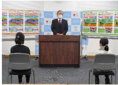
令和3年度表彰式の様子