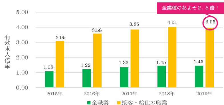
宿泊・飲食業の接客に係る有効求人倍率

本サイトは常に最新の情報を随時更新しておりますので、事業者様は各モードを超えて取組をご参考等いただければ幸いです。業界団体や事業者様から随時募集しているものは優良な取組だけでなく、本サイトでの要望・改善のご意見や、人材育成にかかるご相談の窓口等としても活用頂ければ幸いです。また、求職者のみなさまについては、本サイトを通じて、少しでも運輸・観光業界の魅力や働き方について触れて頂けるような内容にしています。