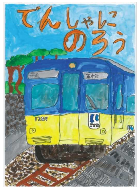
香川大学教育学部附属高松小学校

恐竜で公共交通の安全性を表現しているのでしょうか。とてもユーモア溢れる作品に仕上がっています。