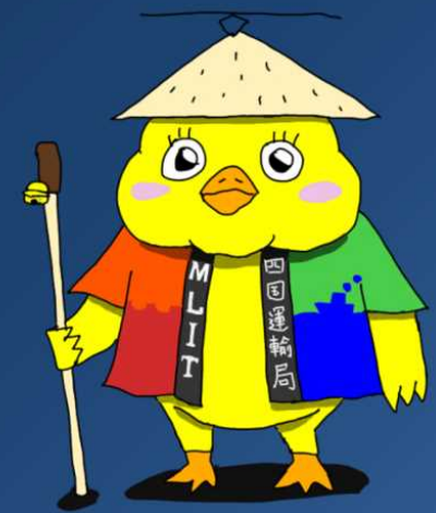
四国運輸局オフィシャル マスコットキャラクター 「ぴよちゃん」