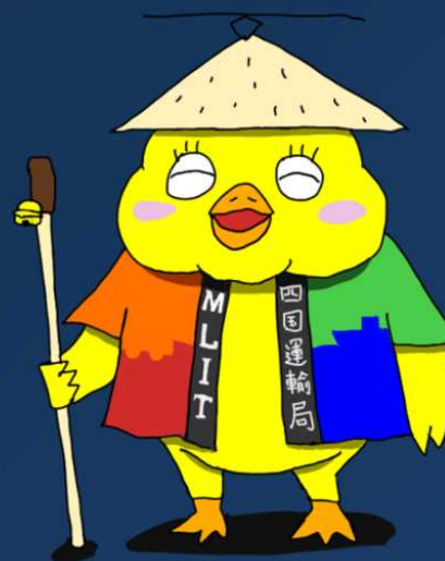
四国運輸局オフィシャル マスコットキャラクター 「ぴヨンちゃん」