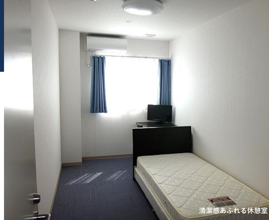
清潔感あふれる休憩室

また、社員寮や社宅を備えている造船所が多く、家賃や水道光熱費などの生活費も抑えられます。