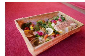
ボタニカルランチ