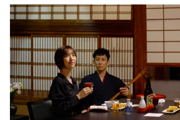
おきゃく文化体験 (お座敷遊び)