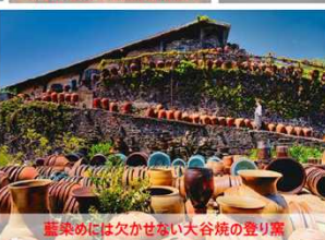
藍染めには欠かせない大谷焼の登り窯