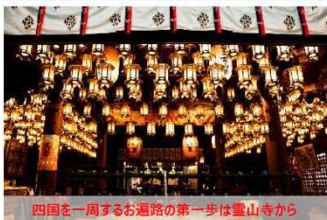
四国を一周するお遍路の第一歩は霊山寺から