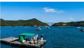
ウチノ海の筏では釣りはもちろん、バーベキューも楽しめる