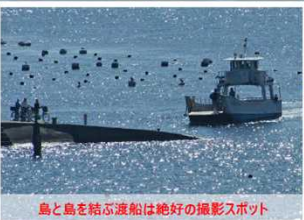
島と島を結ぶ渡船は絶好の撮影スポット