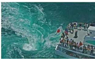
観潮船では吸い込まれそうな渦潮が目の前に