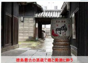
徳島最古の酒蔵で郷と美酒に酔う