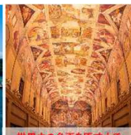
世界中の名画を原寸大で楽しめる大塚国際美術館