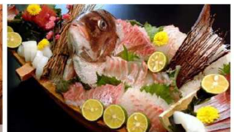
鳴門の潮流で育まれる絶品の海産物