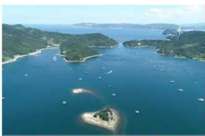
VRゴーグルとドローンで新たな絶景体験を