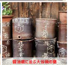
醤油蔵に並ぶ大谷焼の壺