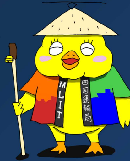
四国運輸局オフィシャル マスコットキャラクター 「ぴヨンちゃん」