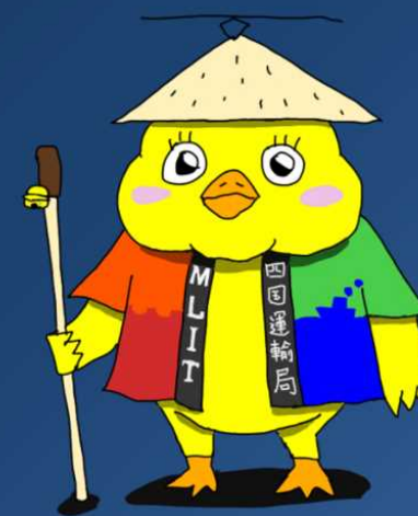
四国運輸局オフィシャル マスコットキャラクター 「ぴヨンちゃん」