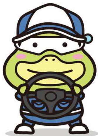
労働基準局広報キャラクター たしかめたん