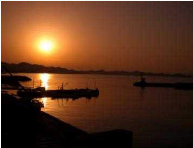
休憩所屋上展望デッキから眺める夕日

まつやま・ほりえ海の駅「うみてらす」は、堀江港にあり、海上には既存の施設を活用した給水・給電施設を備えたビジターバースを、陸上には誰でも気軽に立ち寄り集うことができる休憩所等を整備し、フリーWi-Fiサービスも提供しています。