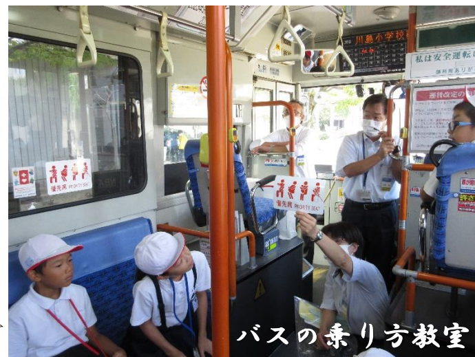
バスの乗り方教室