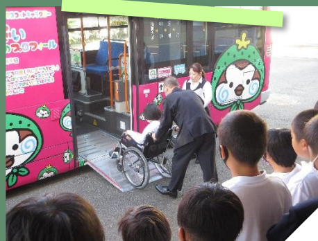
▲ 車いす利用者の乗降見学