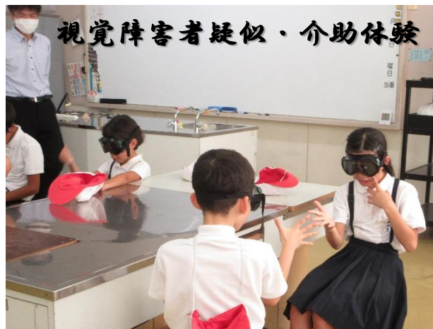
視覚障害者疑似・介助体験