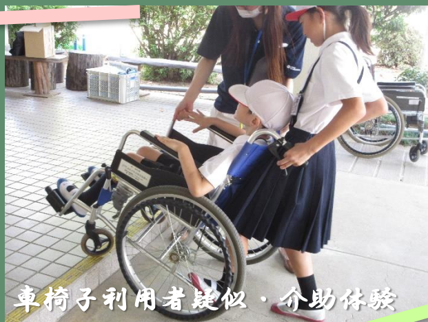
車椅子利用者疑似・介助体験