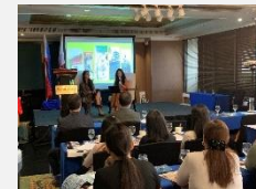
旅行会社との商談

「新たな旅のスタイル」への対応がなされた旅行商品の国内外OTAへの掲載、旅行会社との商談会などを支援。