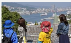
少人数、貸切に対応したガイドツアー