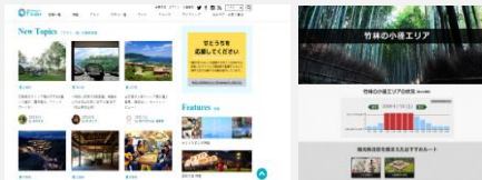
安全に関する情報の発信 観光地の混雑状況の情報提供

地域内の感染症対策や観光地の混雑状況の情報提供など、安心して観光を楽しめる環境づくりを支援