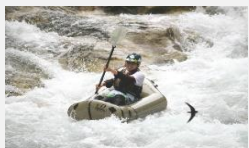
自然を活かしたアクティビティ

地域独自の観光資源を活用した滞在コンテンツで、三密を避けるなど、新たな生活様式を実践したコンテンツの造成を支援。