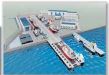
造船所集約化のイメージ（気仙沼市）