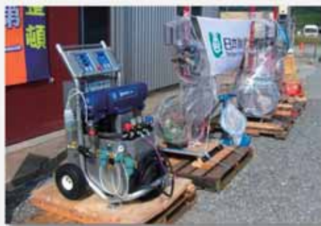
提供されたアルミ溶接機等の設備（大船渡地区）