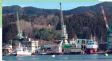
地盤沈下は残るまま応急復旧にて操業