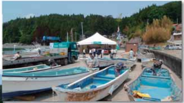
（左・上）南三陸町志津川の仮設修理場 H23.6.10

震災により被害を受けた小型漁船約2万隻のうち、約1千隻は簡易な修理により再使用が可能と見込まれたが、造船所等の修理施設も壊滅的な被害を受けていたため修理の実施が難しい状況にあった。