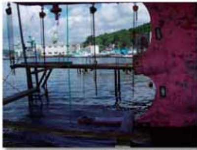
地盤沈下の影響で船尾が水に浸かる船台（気仙沼市）H24.10.19

海事局と東北運輸局は、集約・協業化が期待される地域に対し「造船高度化プラン」の策定支援を行った。（「地域造船産業集積高度化支援事業」）