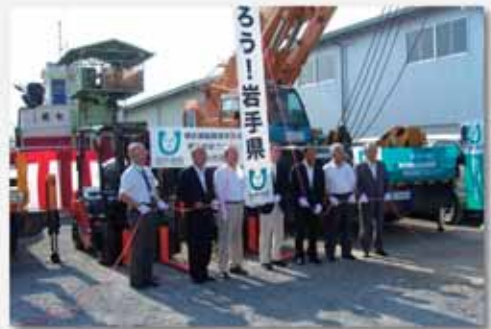
大船渡地区協議会への贈呈式（H23.9.15）