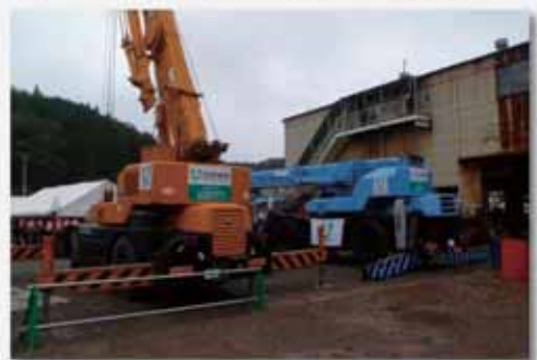
提供されたクレーン車（気仙沼地区）