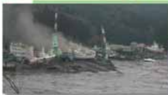
津波に襲われ被災