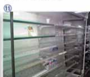
⑪ 仙台市内のコンビニ：震災後、営業中のコンビニやスーパーから食料が消えた。