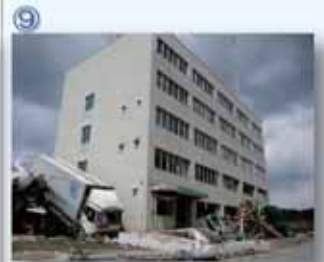
⑨ 気仙沼合庁：津波は3階床面まで達した。