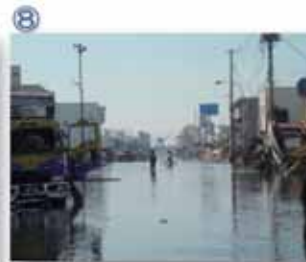
⑧ 石巻市：津波は、石巻港から直線距離で約2.5km先の中心街にも達した。