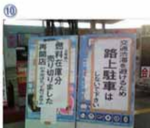
⑩ 仙台市内のGS：震災後、東北地方全体でガソリンの入手が困難となった。