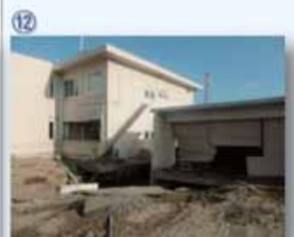
⑫ 石巻港湾合庁：液状化と、津波浸水でダメージが大きく使用不可となった。