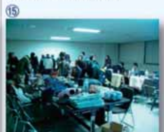
⑮ 仙台第4合庁：非常用発電の明かりが灯る合庁に近隣住民127名が避難してきた。