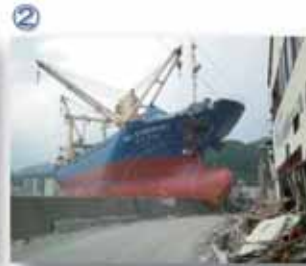
② 釜石市：釜石港で乗り上げた「アジアシンフォニー4724G/T」