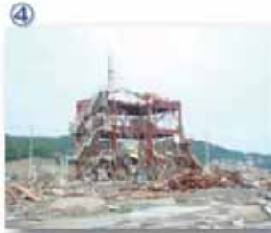
④ 南三陸町：防災対策庁舎。ここから町民に対して津波襲来と避難を呼び続けた。