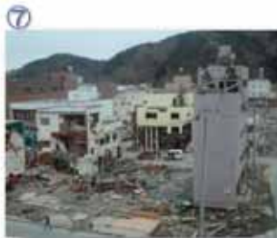
⑦ 女川町：津波は、これら建物の屋上を越えた。