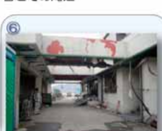
⑥ 宮古港湾合庁：2階天井近くまで浸水。岩手運輸支局宮古庁舎が浸水被害を受けた。