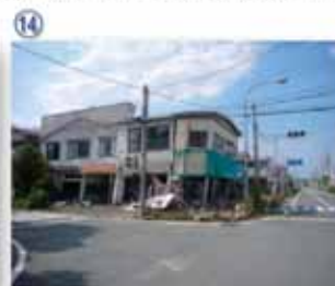
⑭ 浪江町：東京電力福島第1原発の事故による住民避難後は、街は無人状態になり、街の「時」が止まった。