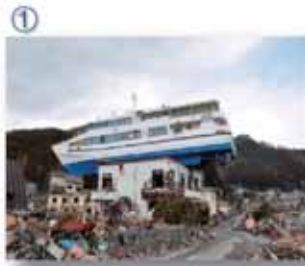
① 大槌町：民宿に乗り上げた釜石市所有「はまゆり」。