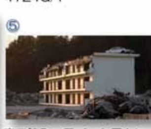
⑤ 南三陸町：アパート屋上に乗り上げた乗用車。船用工業事業者である運転者は、奇跡的に助かった。