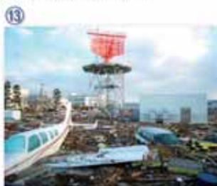
⑬ 仙台空港周辺：滑走路を始め、関連施設の広い敷地がられき等で覆い尽くされた