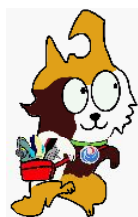
東北運輸局マスコット "とうほくろっ犬"