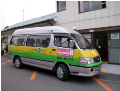
「おだか e-まちタクシー」使用車両 (ジャンボタクシー)

福祉バス等を自ら運行することに比べ自治体の負担も少なく、同町には全国から視察が相次いでいる。