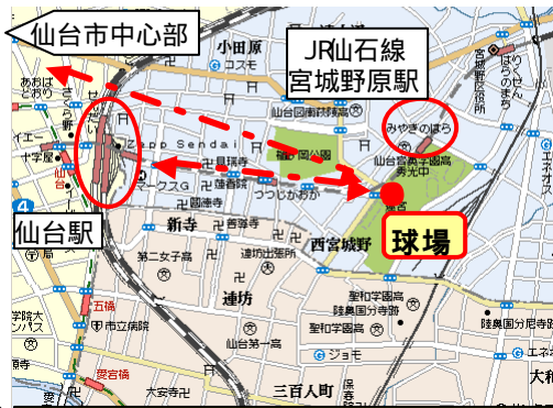
フルキャスト宮城スタジアム周辺地図