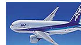
本邦航空運送事業者