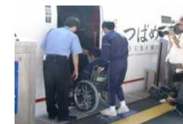
車椅子サポート体験