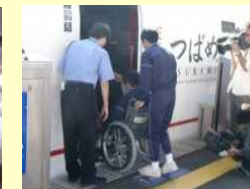
車椅子サポート体験