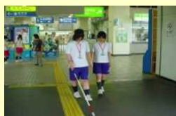
視覚障害者サポート体験

高齢者・障害者等の擬似体験等を通じ、バリアフリーに対する国民の理解増進を図るとともに、「心のバリアフリー」社会の実現を目指して、各運輸局が「バリアフリー教室」を開催。