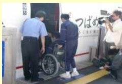
車椅子サポート体験