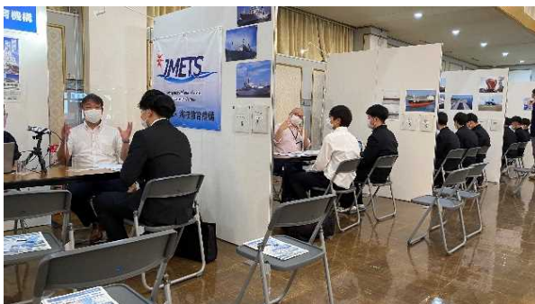
＜昨年度開催のセミナーの様子＞

◇取材希望の報道機関の方は、令和5年7月3日（月）17時まで下記《問合せ先》までご連絡をお願いします。