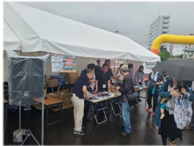
10:30過ぎ 待機列も全て会場内に入場いただき、入場規制を解除。 雨天にもかかわらず、オープンから多くのご来場があり会場内は大盛況！