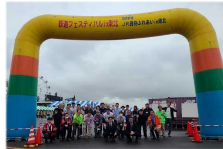
15:00 大きなトラブルもなく、無事フェスティバル終了 来年もご来場お待ちしております！