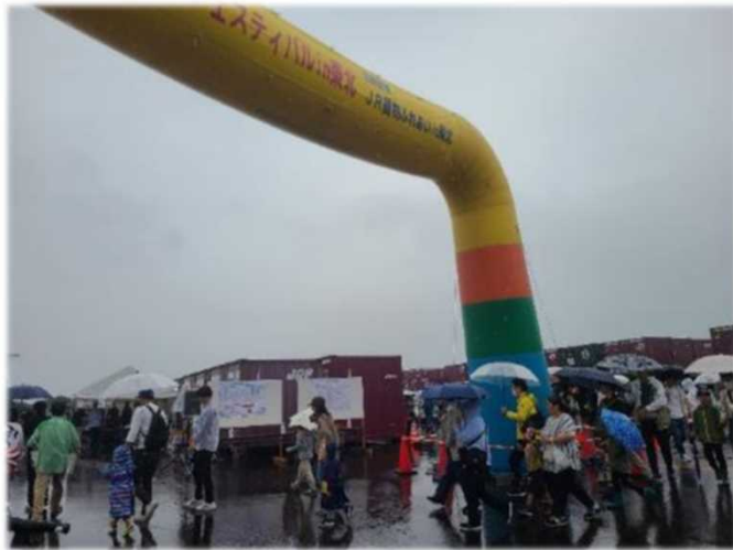
10:00過ぎ いよいよフェスティバルスタート！ 雨の中、大変お待たせしました。