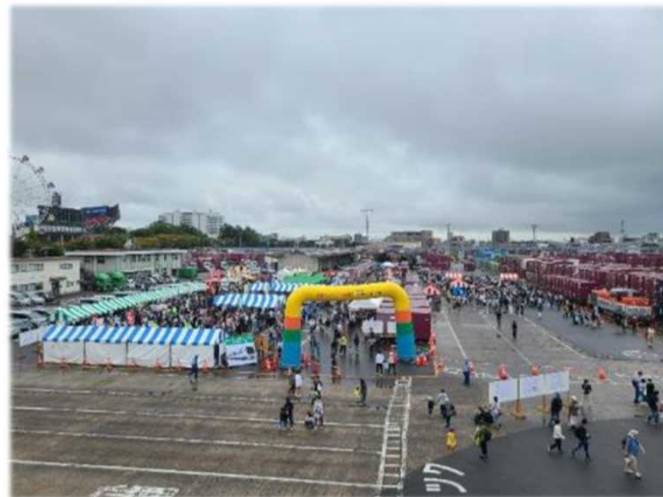
12:00頃 お昼になってもまだまだ大盛況！