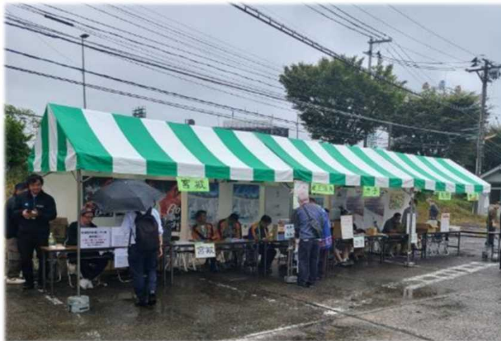
11:00過ぎ お昼前には売り切れてしまったスキーリフト券