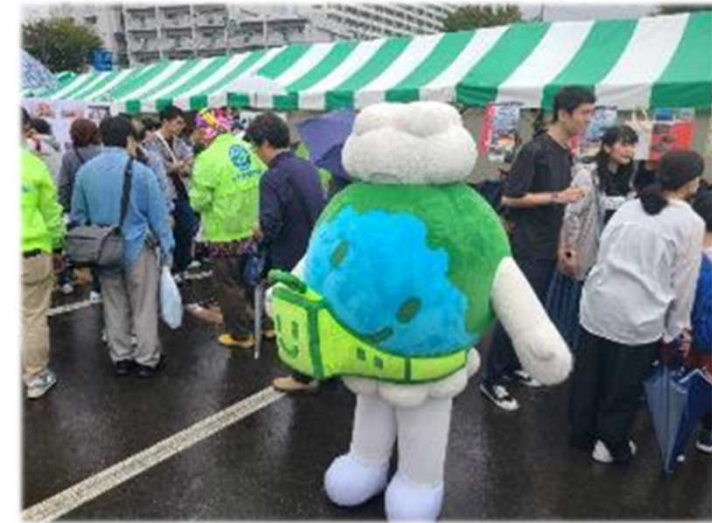
エコレールマークちゃんも出現