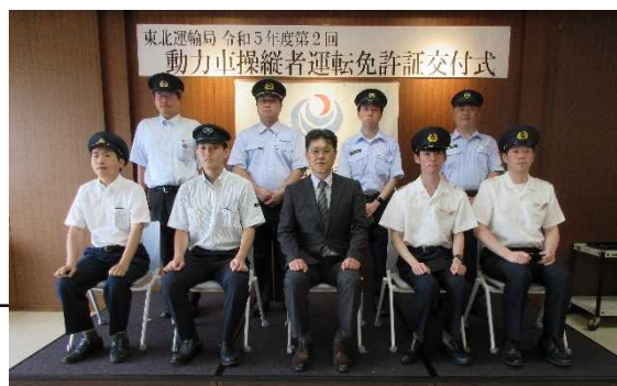
合格者記念撮影（前回）