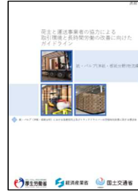
紙・パルプ(洋紙・板紙分野)物流編