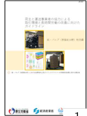
紙・パルプ(家庭紙分野)物流編