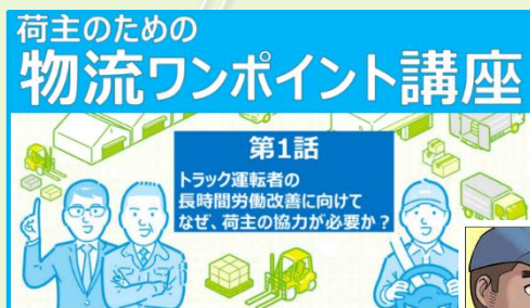
【荷主の皆様向け動画】

また、令和3年6月には、新たなコンテンツとして、荷主企業向けのショートセミナー形式の連載動画「 荷主のための物流ワンポイント講座 」を掲載しています。