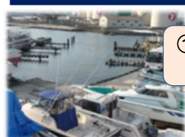
①あおもり海の駅 (青森県青森市)