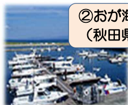
②おが海の駅 (秋田県男鹿市)