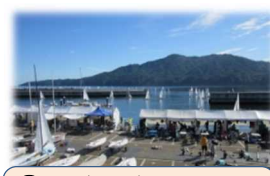
⑤みやこ海の駅 (岩手県宮古市)