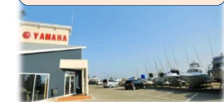
⑦いわき海の駅 (福島県いわき市)