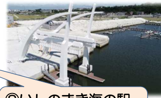
⑧いしのまき海の駅 (宮城県石巻市)