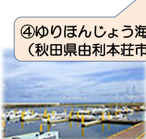
④ゆりほんじょう海の駅 (秋田県由利本荘市)