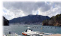
⑥おおふなと海の駅 (岩手県大船渡市)