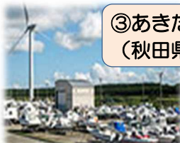
③あきた海の駅 (秋田県秋田市)