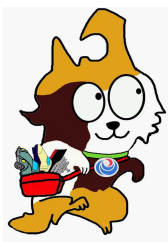
東北運輸局マスコット "とうほくろっど"

※手続の終了後に、警察・運輸支局において、保管場所ステッカーおよび車検証等の受取が必要