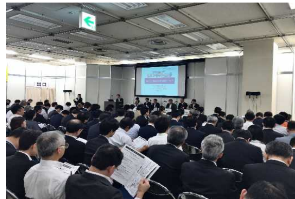
アジア・シームレス物流 フォーラム2019東京 パネルディスカッション 「ホワイト物流」