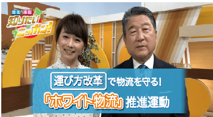
「徳光 & 木佐の知 りたいニッポン！」 (BS・TBS) 6月2日・9日 放送