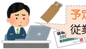
賃金の支払に困る事業主のAさん