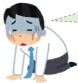
賃金の支払に困る事業者のAさん