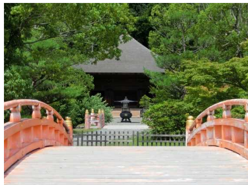
〈国宝白水阿弥陀堂〉